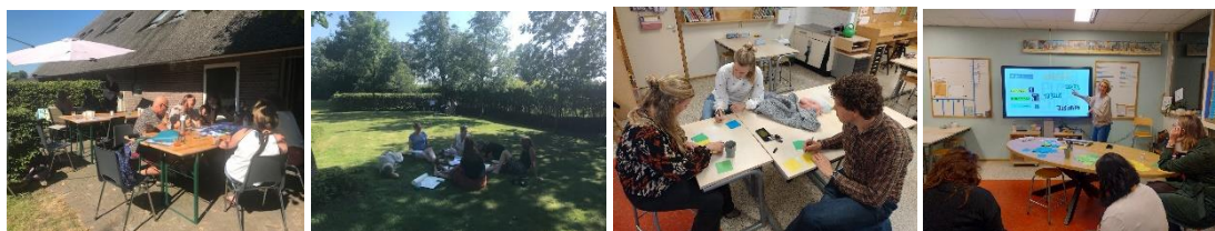
Foto's van werksessies met het team en ouders voor de burgerschapskaartjes

Onze wekelijkse KiVa kring (sociale veiligheid) wordt vanaf heden afgewisseld met de burgerschapskring. Voor alle burgerschapsdoelen van het SLO (2024) zijn er stamgroepkaartjes burgerschap gemaakt voor de categorieën gesprek, spel, werk en viering. Dit in samenwerking met het hele schoolteam, ouders en de vakleerkracht gym.