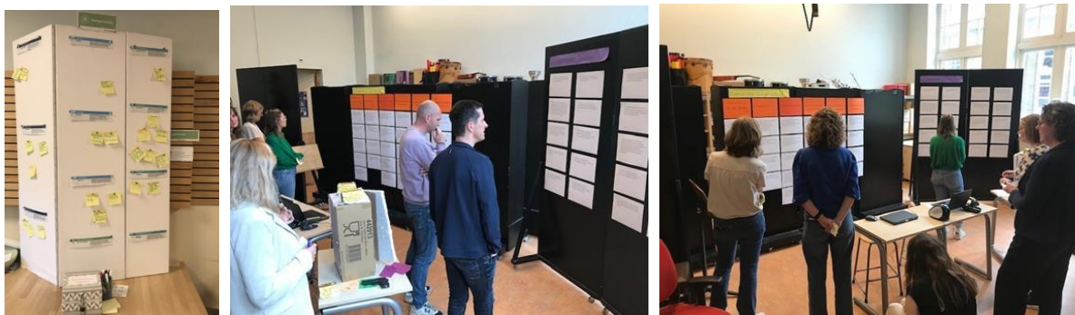
Foto's inventarisatie burgerschapsonderwijs (maart 2024) en visievormingsactiviteit met het team (april 2024)

Burgerschap en Jenaplan hebben veel raakvlakken. Jenaplanonderwijs is een pedagogisch concept en een samenleving in het klein. De kern van het jenaplanonderwijs is wereldoriëntatie. Wij werken met driejarige heterogene stamgroepen waardoor diversiteit in ontwikkeling en niveau ons uitgangspunt is. In dit beleidsplan koppelen wij ons jenaplanonderwijs aan burgerschap en beschrijven wij expliciet ons aanbod en de kwaliteitszorg ervan. Wij hebben een werkgroep burgerschap, met medewerkers uit elke bouw en een coördinator burgerschap. Aan de hand van de Jenaplan basisprincipes en kernkwaliteiten en de concept kerndoelen burgerschap van SLO hebben we een visievormingsactiviteit gedaan met ons team.